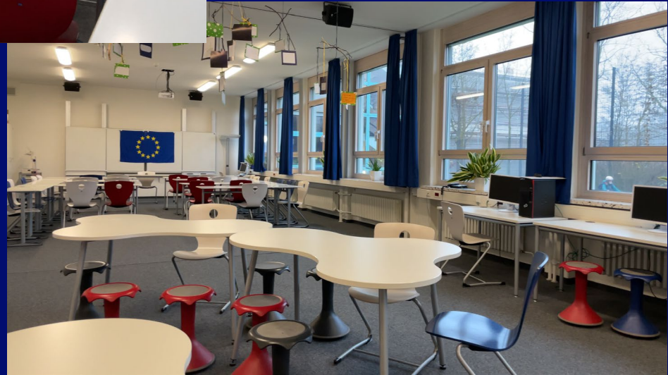
CDI (Centre de documentation et d'information)