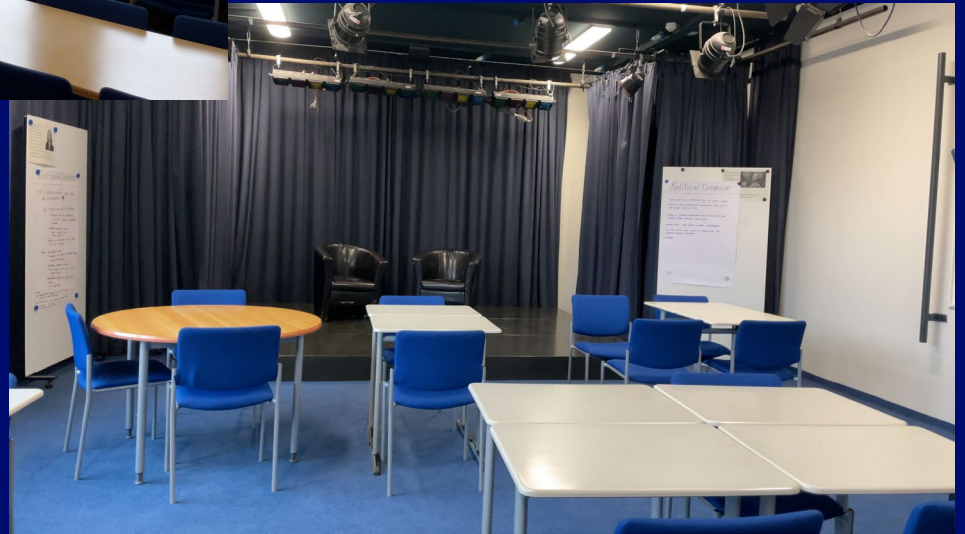
ACE (Activity Centre English)